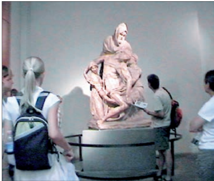
▲ Abb. 3, „Pietà“, Video-Still, 2004.