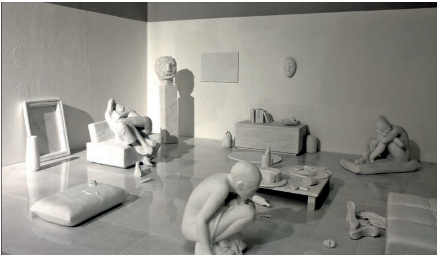
Abb. 6, „White Cube“, Laaser Marmor, 2007 bis 2009.