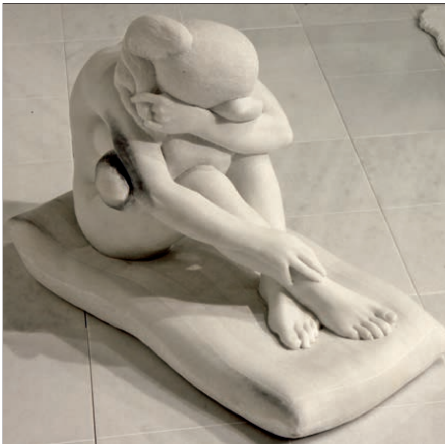
Kauernde, Laaser Marmor, 2008.

In der Neuzeit wurde die Geschichte auch als ein Gleichnis für die Unfähigkeit der Bildhauerei ausgelegt, lebendige Kreaturen zu schaffen oder zumindest die Leidenschaft des Rezipienten durch optische Stimuli zu entfachen. Des Öfteren nahmen Maler – die man heute vielleicht nicht