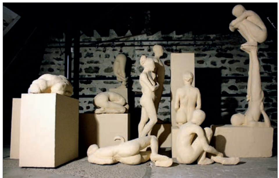
Abb. 5, „Bildzeitraum 3“, Museum Schloss Bruck, 2009.

Die materielle Verbindung von Grund und Motiv erlaubt dem Relief, Figuren in eine homogene Umgebung zu stellen. Die Freiplastik steht ihrer Umgebung, die ja