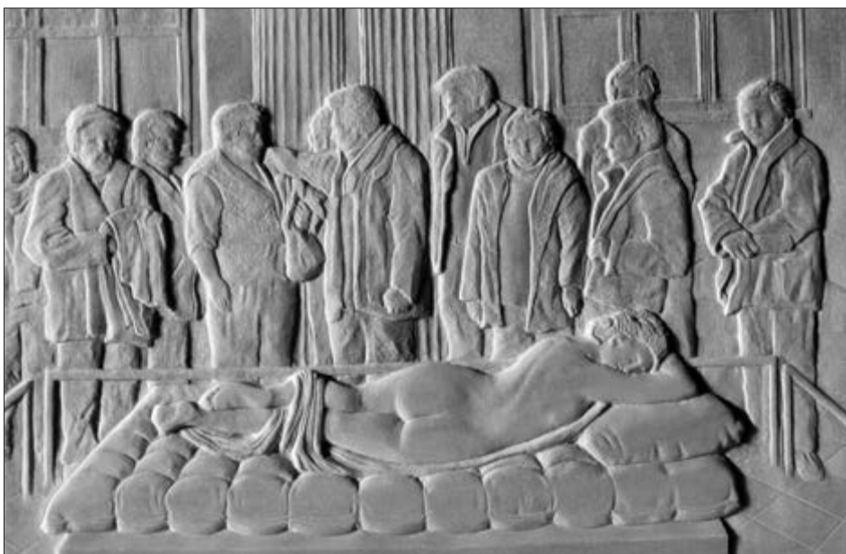
Abb. 2, „Schlafender Hermaphrodit“, Laaser Marmor, 40 x 60 cm, 2007.

Trotzdem sehen diese Arbeiten, die zu einem guten Teil auf großformatige Leinwände gemalt sind, auch die Betrachtungsweise von Bildtafeln vor. Dazu ist ein Fokuswechsel vonnöten, der aus einiger Entfernung das Gesamtbild ins Auge zu fassen erlaubt. Von dort wird eine Komposition wahrgenommen, die nicht mehr durch den digitalen Code, sondern durch analog sich abbildende Eigenschaften des Malvorganges strukturiert ist: durch die Unterschiede im Grauwert zum Beispiel, die den Zeitpunkt und die Stelle anzeigen, an denen der Künstler den fast trockenen Pinsel erneut in die Farbe getaucht hat. Der Grauwert entspricht der Menge an schwarzer Farbe, die so gesetzt ist, dass sie die beschatteten Körperpartien zusammenfasst und mit den ausgesparten hellen Stellen des Grundes den Eindruck von Plastizität oder Relief der gemalten Figürchen erweckt.