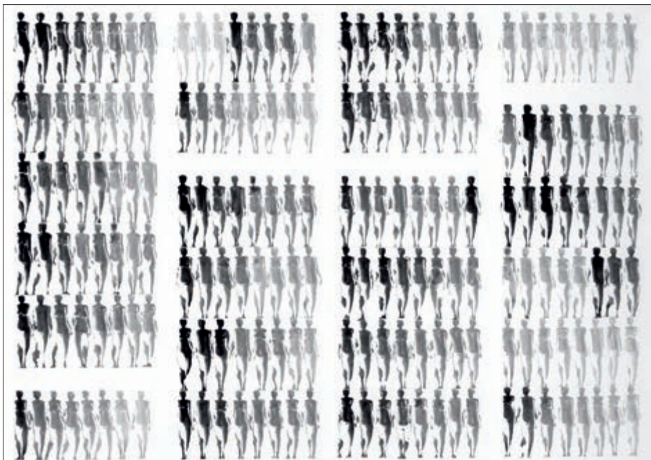
Abb. 1, Acrylpinselzeichnung (Ausschnitt), 2001.

entsprechen und daher natürlich nicht sichtbar sind. Die Arbeiten, mit denen Ende der 90er-Jahre Peter Niedertscheider seine ersten Lorbeeren verdiente 5 , beruhen auf einer Visualisierung, welche die binäre Opposition dieses Codes als männliche und weibliche Figuren darstellt (Abb. 1). Durch konsequente Übung zur raschen Niederschrift optimiert, bilden acht aneinander gereihte Figuren Laut- oder Satzzeichen, die, in der linken oberen Ecke des Bildträgers beginnend, sich zu Kolumnen formieren und auch in dieser Richtung zu lesen sind. 6