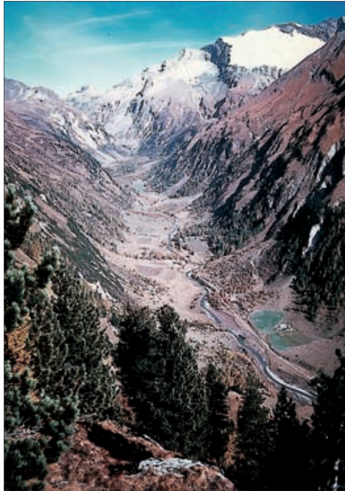
Das Kalser Dorftal ungefähr vom Standpunkt der westseitigen Mauerkrone gegen Norden.