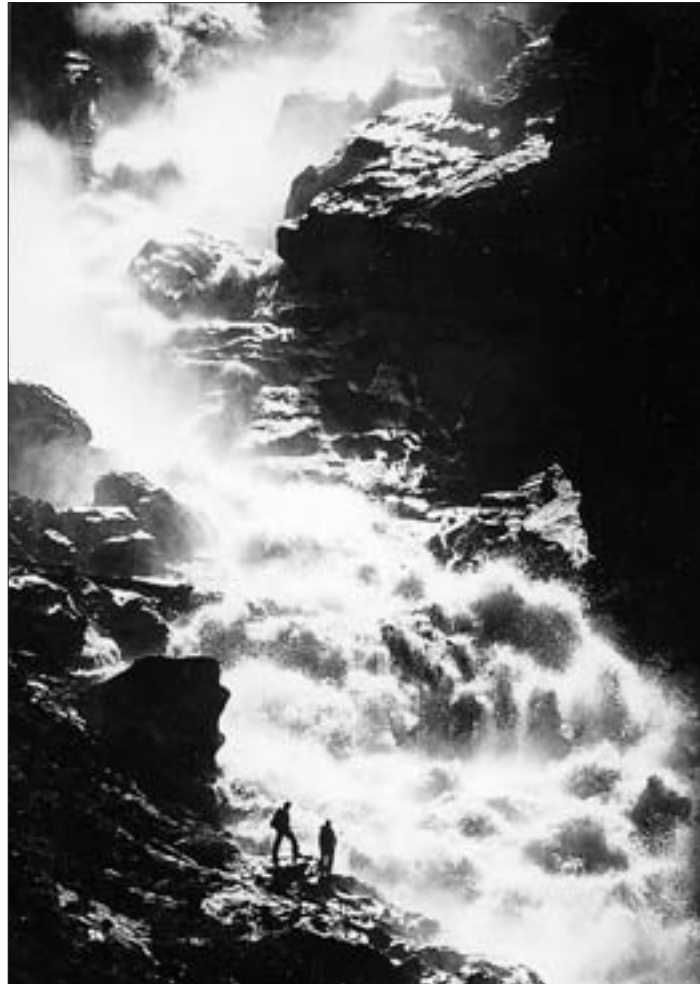
Das Schauspiel der Iselkatarakte.