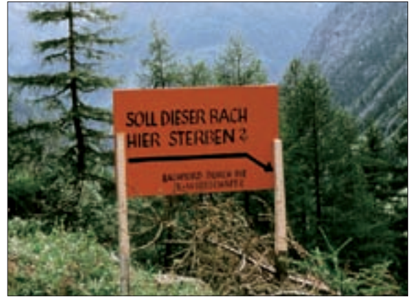
▲ Hinweistafel auf Bachableitung anlässlich des Ministerbesuches vom August 1975.