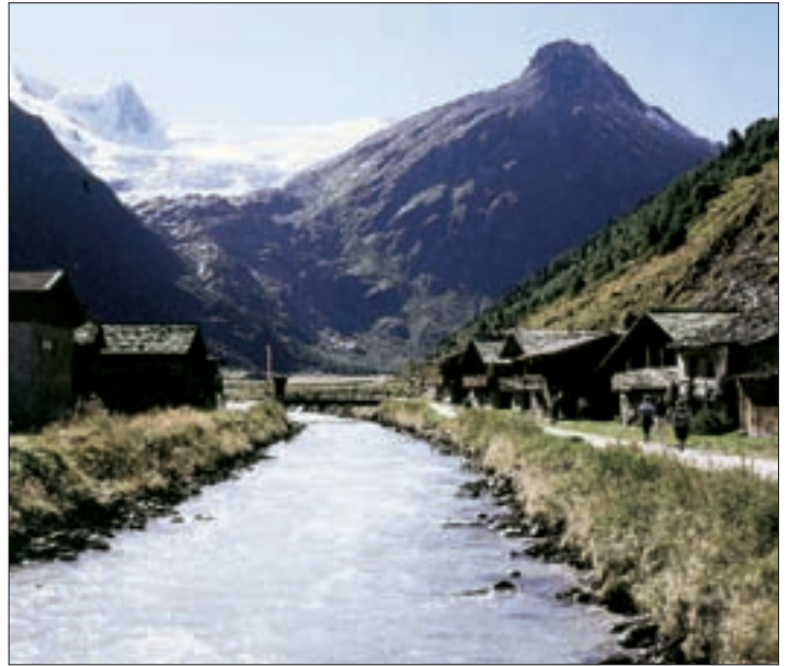
▲ Innerschlöß mit Blick zum Venedigermassiv. Der Bach entlang dieses viel begangenen Wanderweges würde nur mehr durch „Pflichtwasser“ gespeist.