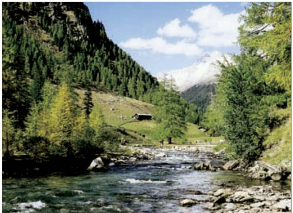
Die Schwarzach im hinteren Defereggental mit normaler Wasserführung.

Der Anlass zur Gründung des Vereins war schließlich die neu begonnene Kraft-