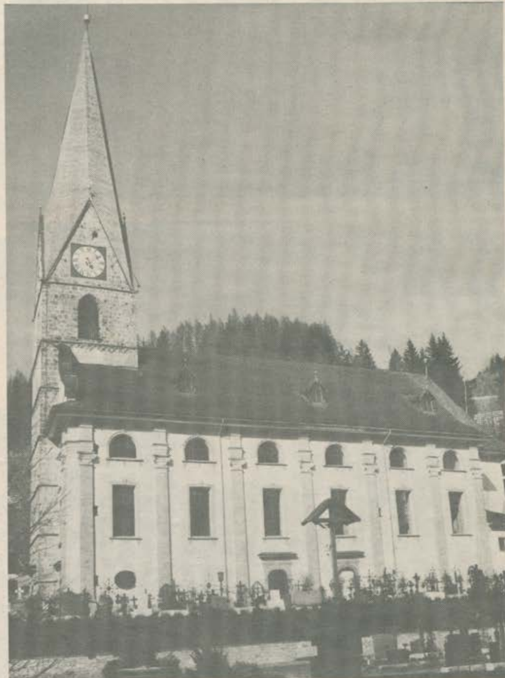
Die St. Albanskirche von Matrei