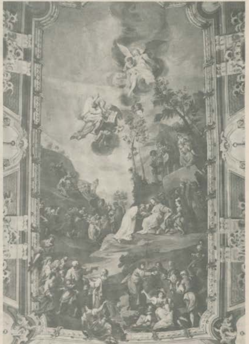
F. A. Zeiller: Fresko im Langhaus; Wunder der Brotvermehrung