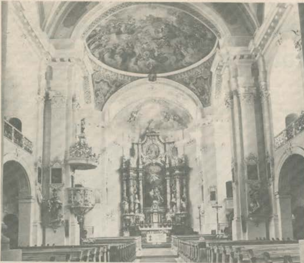
Blick in den Chor