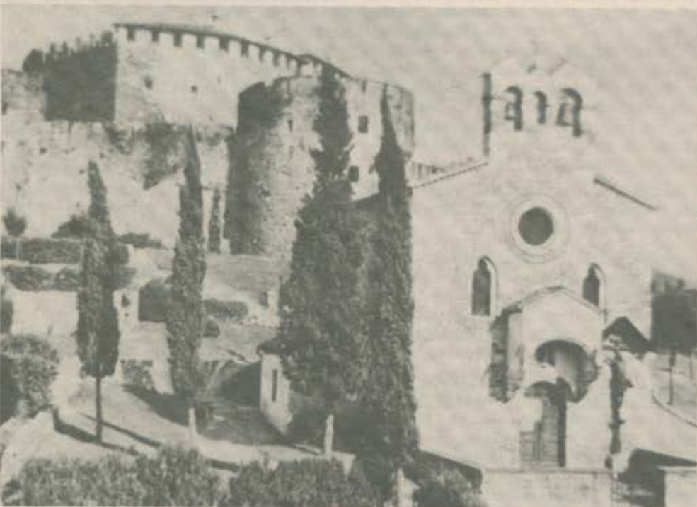
Burg Görz; die bedeutendsten Residenz-Sitze der Grafen von Görz/Tirol.