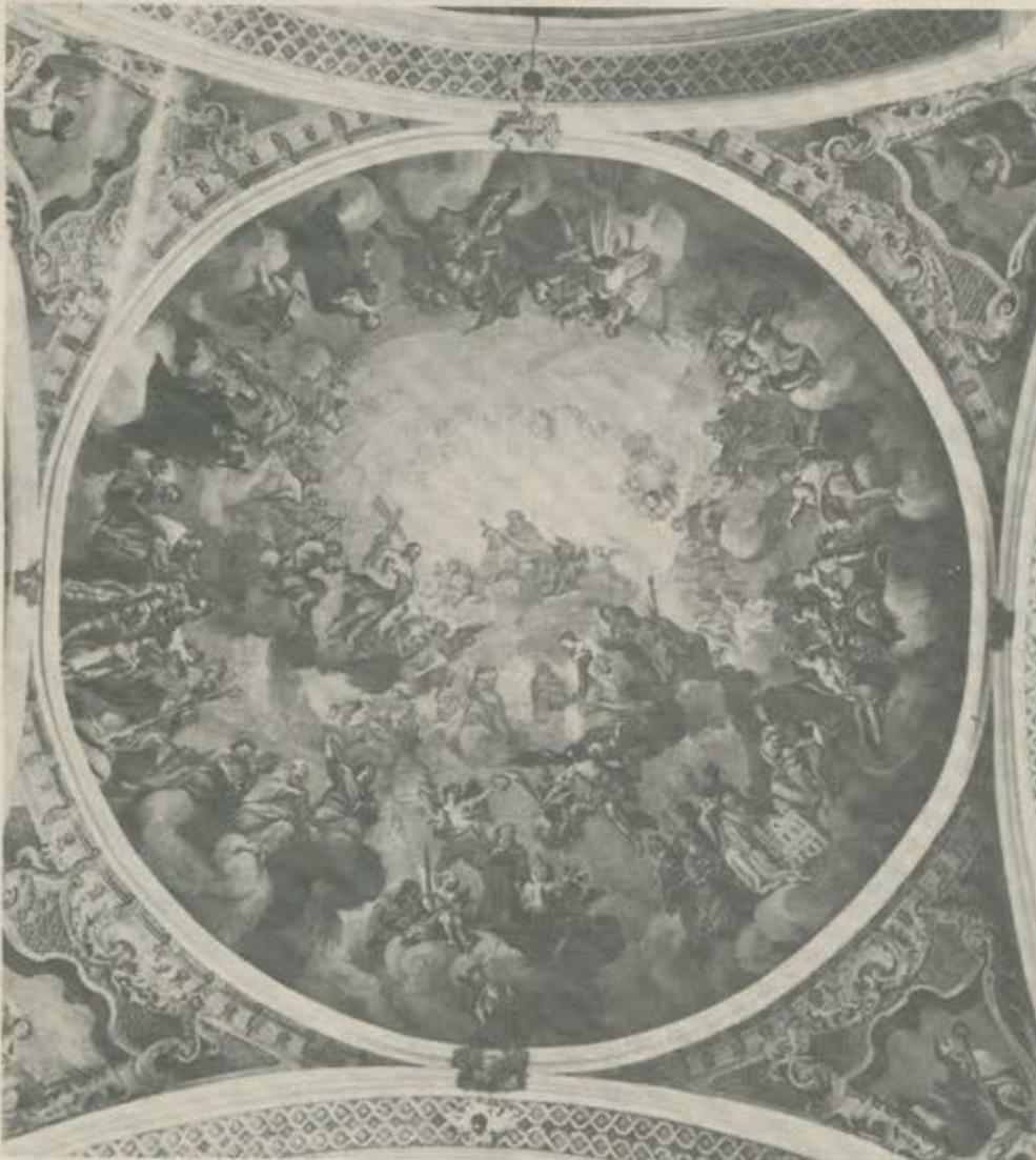
F. A. Zeiller: Fresko der Vierungskuppel; Glorie des hl. Alban;

über die ganze Breite eine Empore eingezogen, die — wie heute der Chor — von Säulen gestützt wurde. Die 1663 errichtete Orgel erhielt an der Evangeliumseite und etwas erhöht ihren Platz.