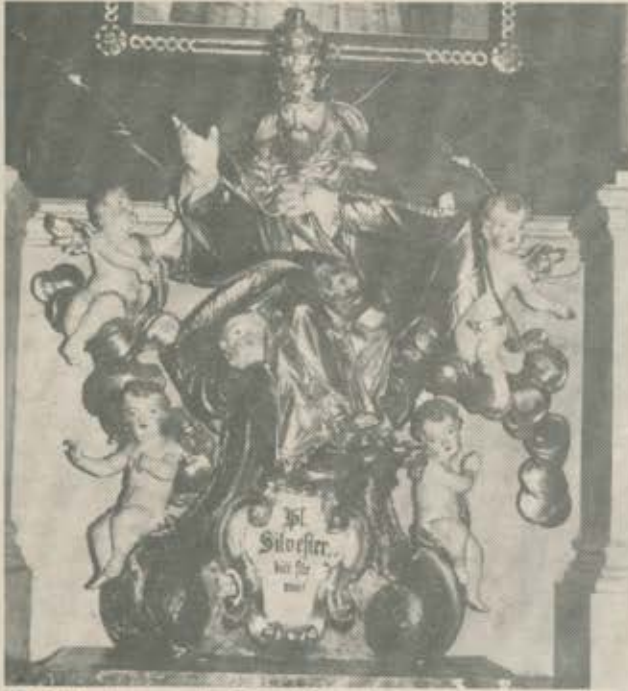
Hl. Sylvester vom 2. linken Seitenaltar

Im folgenden Jahr (1777) übertrug man das Allerheiligste in das Widum, und die alte Kirche mit Ausnahme des Turms wurde vollständig abgebrochen. Zum Einreißen der Mauern verwendete man damals schon eine Winde. Am 3. August wurde dann — mit Erlaubnis des Konsistorialamtes — der Grundstein für die neue St. Albanskirche gelegt und geweiht. Dies geschah mit keiner geringen Feierlichkeit. 39 »Feierschützen« wurden Tage vorher »exerciert und kommandiert«. Laut Rechnung verbrauchten sie