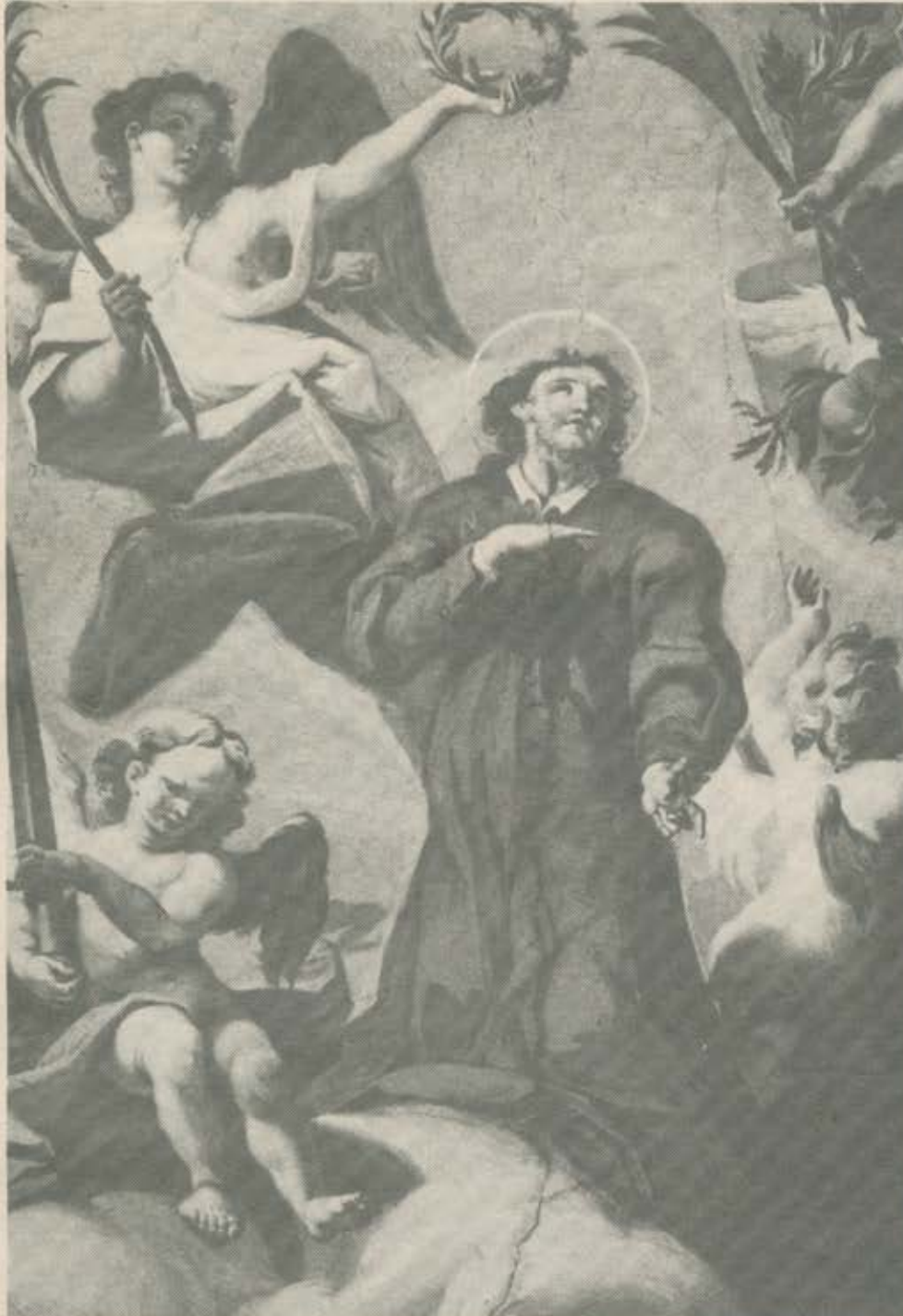
Ausschnitt aus dem Fresko der Vierungkuppel; Glorie des hl. Alban;

Alles in allem wurden also 12 Jahre Arbeiter beim Kirchenbau beschäftigt. Die reine Bauzeit betrug 8 Jahre (1776–1783) aber schon in drei Bauperioden war die Arbeit soweit fortgeschritten, daß in der Kirche Gottesdienste gefeiert werden konnten.